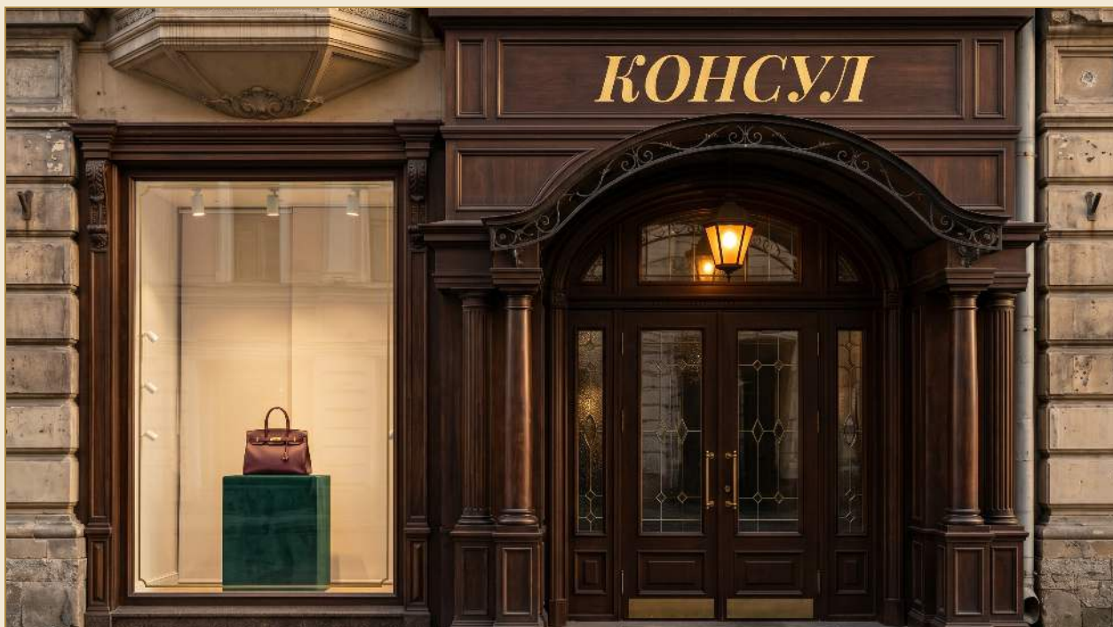
ФАСАД МАГАЗИНА · УЛ. ЛЕНИНА, 36