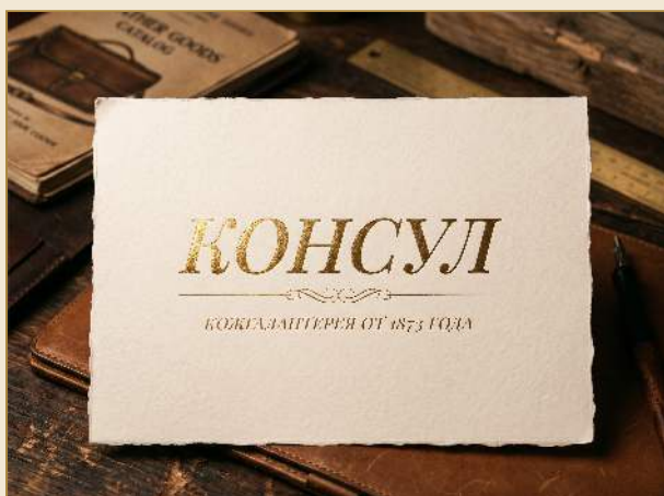
ЗОЛОТАЯ ФОЛЬГА НА ПЕРГАМЕНТЕ