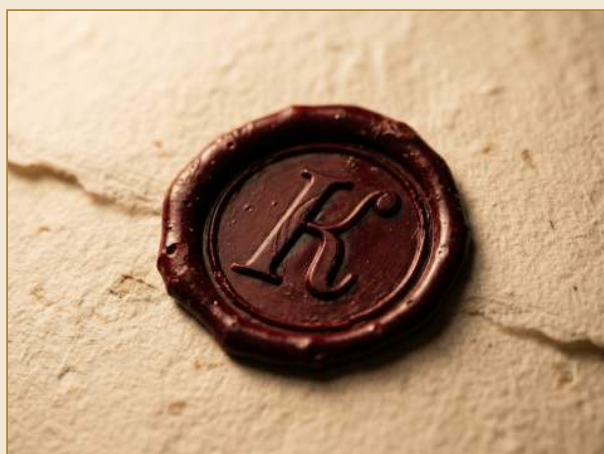
СУРГУЧНАЯ ПЕЧАТЬ НА УПАКОВКЕ