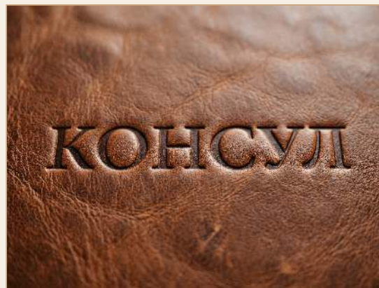
СЛЕПОЕ ТИСНЕНИЕ НА КОЖЕ