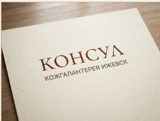
ПЕЧАТЬ НА БУМАГЕ MUNKEN PURE CREAM

Эти кадры — генеративные эскизы того, как логотип ляжет на бумагу, кожу и фасад. Финальные образцы делаются в типографии с настоящим тиснением.