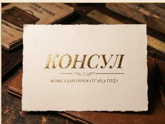
ЗОЛОТАЯ ФОЛЬГА НА ПЕРГАМЕНТЕ

Генеративные эскизы — как ляжет логотип на бумагу, фольгу, сургуч. Финальные образцы — в типографии с реальной фольгой и печатью.