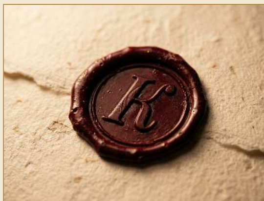
СУРГУЧНАЯ ПЕЧАТЬ НА УПАКОВКЕ